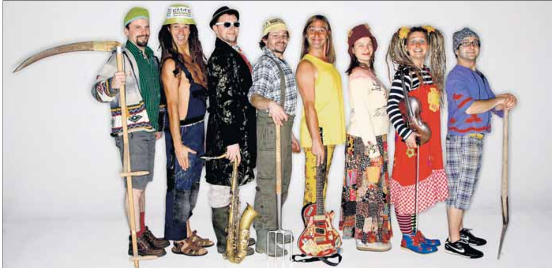
Vor allem Spaß haben und die Freude an andere weitergeben wollen die acht Bandmitglieder von „Weißwurscht is“.